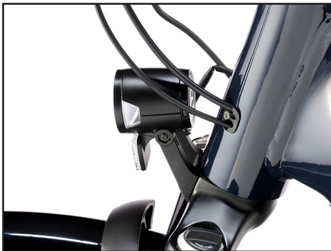
Fixation Mobie (antérieure)

Si vous ne savez pas si votre vélo est concerné par ce rappel, veuillez communiquer avec votre détaillant Trek. Si votre vélo est équipé de la fixation de feu avant à pivots multiples qui suit, il n'est pas touché par le présent rappel.