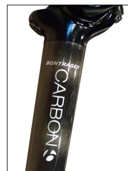
FIGURE 2. Tige de selle carbone Bontrager Approved