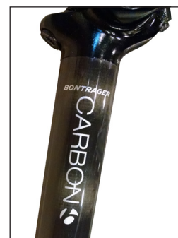
FIGURE 2. Tige de selle carbone Bontrager Approved