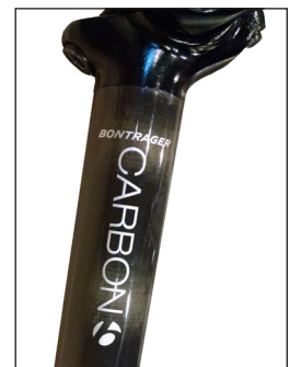
FIGURE 2. Tige de selle carbone Bontrager Approved