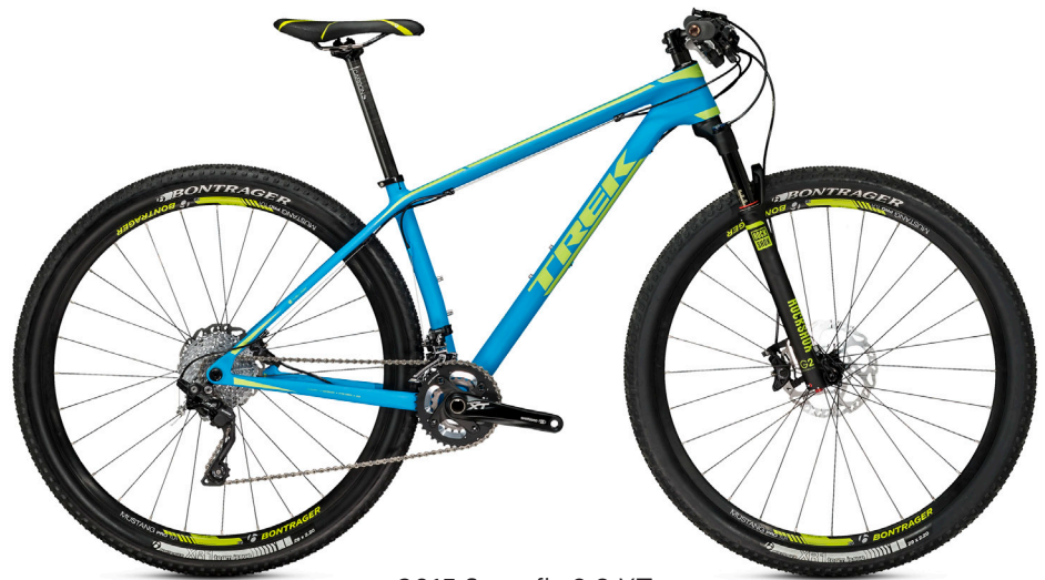
2015 Superfly 9.8 XT