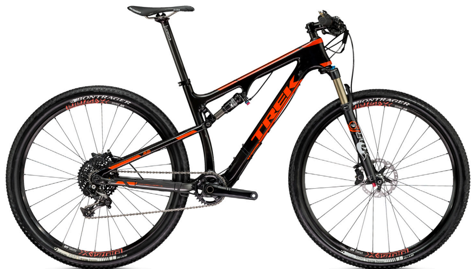
2015 Superfly 9.8 FS SL